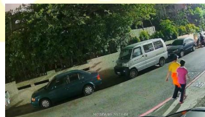
低光色彩仍舊完美呈現