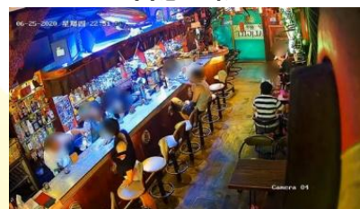
混亂光源依然清晰完美