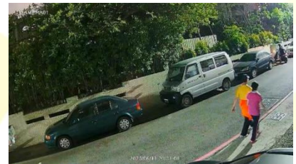
低光色彩仍舊完美呈現