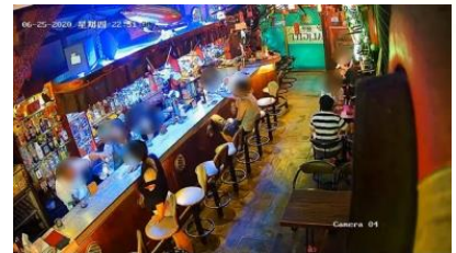
混亂光源依然清晰完美